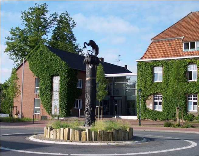
Abbildung 9: Kreisverkehr

In der Nähe des Einganges würden wir ebenfalls eine der vom Modell ausgewählten Informationstafeln aufstellen, um den Besucher*innen auch hier die Möglichkeit zu bieten Informationen über die Stadt zu erhalten.