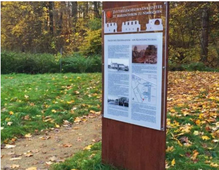
Abbildung 11: Beispiel Informationstafel