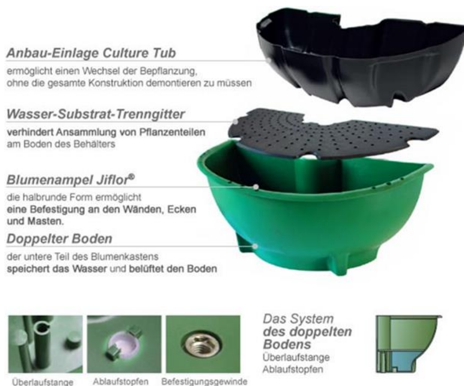
Abbildung 7: Beispiel Blumenampel

Für die Umsetzung dieser Idee würden sich Blumenampeln optimal eignen. Eine mögliche Blumenampel ist in Abbildung sieben dargestellt (atech.de, Blumenampel Jiflor 600) (s. Abb.7).