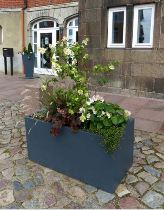
Abbildung 8: Blumenkasten