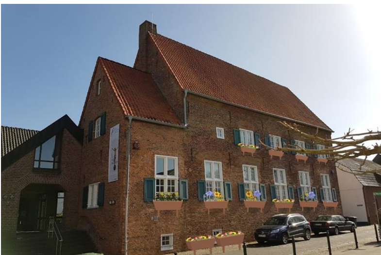
Abbildung 2: Bepflanzung - Museum Katharinenhof

Wie in der Präsentation angesprochen, sind besonders die Autostellplätze vor dem Haus sehr unansehnlich. Um diese Unterbrechung des visuellen Reizes des Hauses zu vermeiden, könnte eine Reihe von kleineren, ebenfalls bunt bepflanzten Hochbeeten vor der Außenmauer platziert werden. Die einfache oder saisonale Bepflanzung müsste mit den darüber hängenden Blumen vor den Fenstern abgestimmt werden (s. Abb. 2).