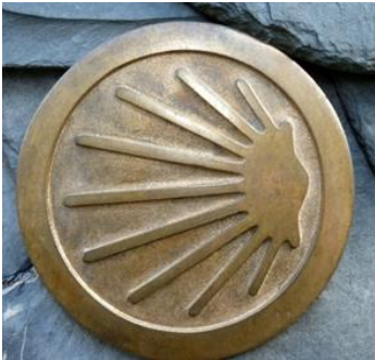
Abbildung 5: Jakobsmuschel

Informationstafel integrieren, um mehr Aufmerksamkeit auf die Bedeutsamkeit des Weges zu bringen und es möglicherweise sogar als Marketing-Option in Erwägung ziehen. Das Muster der Muschel kann ebenfalls bildhaft in die Blumenbeete integriert werden. In Abbildung fünf und sechs ist die Symbiose der Jakobsmuschel und einem möglichen Blumenbeet mit Eisenkraut und dem Pampasgras veranschaulicht. Dies würde einerseits Aufmerksamkeit auf den Jakobsweg lenken, sowie auf unseren lokalen Auftraggeber Stauden Peters, da das Pampasgras in der Umgebung schon als Markenzeichen seines Unternehmens gezählt werden kann.