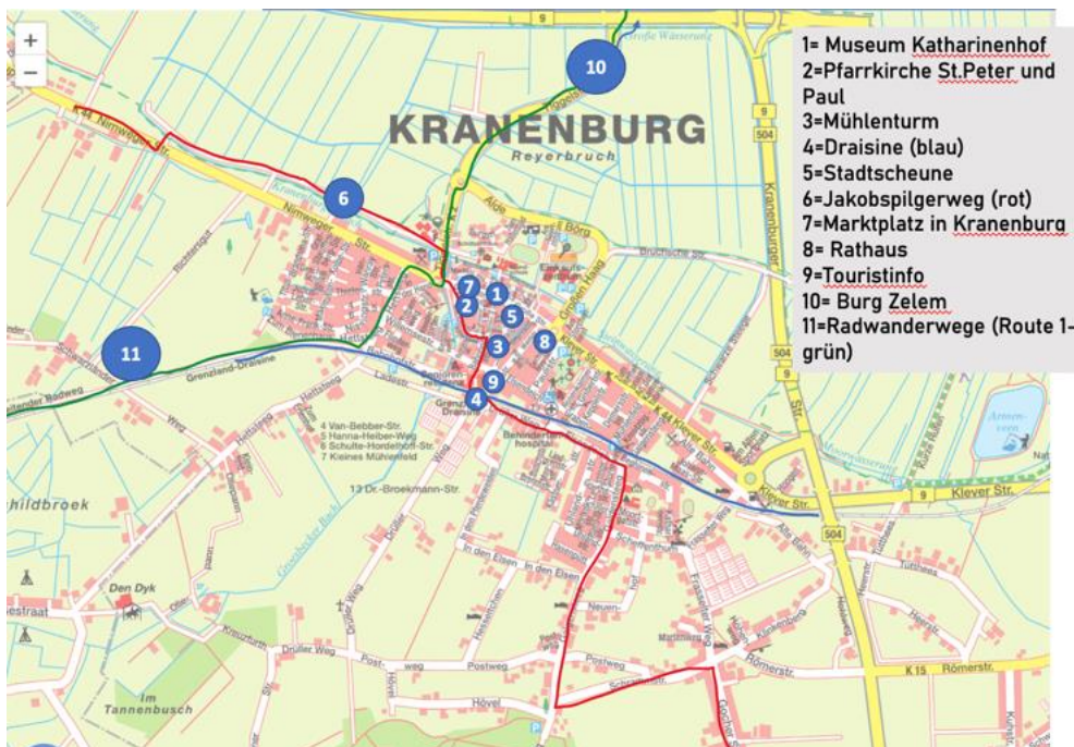
Abbildung 1: Bepflanzungsstandorte in Kranenburg

(Shahid, 2020, S. 1887). In Absprache mit Stauden Peters wurde ebenfalls herausgestellt, dass diese bereits mit der Pflanze Eisenkraut arbeiten. Aufgrund der mehrjährigen Eigenschaft stellt Eisenkraut einen geringen Pflegeaufwand dar. Des Weiteren wird an jedem Standort eine einheitliche Informationstafel platziert. Solche bewegen sich in einem geldlichen Rahmen zwischen 200 Euro und 700 Euro. Inhalt dessen werden Beschreibungen zu den Pflanzen, deren Verbindung mit der dementsprechenden Sehenswürdigkeit und mögliche Verweise zu Kooperationen (s. Punkt 7). Mit Hilfe der Informationstafeln wird der rote Faden erkennbarer. Außerdem besteht die Möglichkeit zu Kooperationen, welche die soziale und ökologische Nachhaltigkeit fördern sollen. Auch ist die Auseinandersetzung mit der Vermarktung der Blumenstadt Gegenstand der Projektausarbeitung.