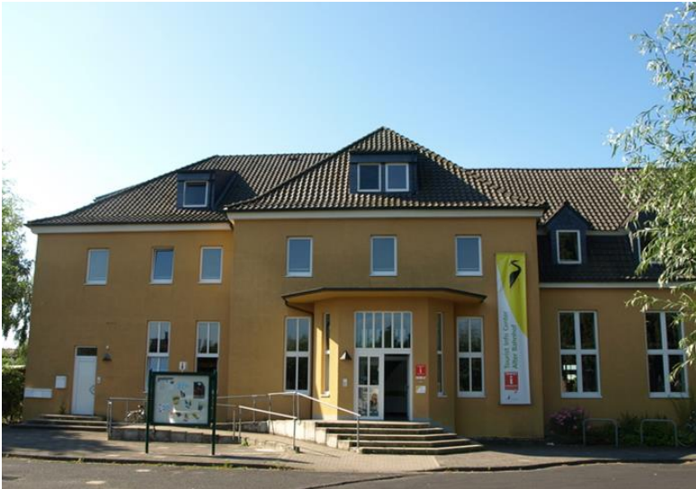
Abbildung 10: Tourist Info Kranenburg

wiederkehrenden Element Eisenkraut bepflanzen. So wird der Eingang des Tourist Info Centers einladender gestaltet.