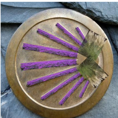
Abbildung 6: Bepflanzung - Jakobsmuschel