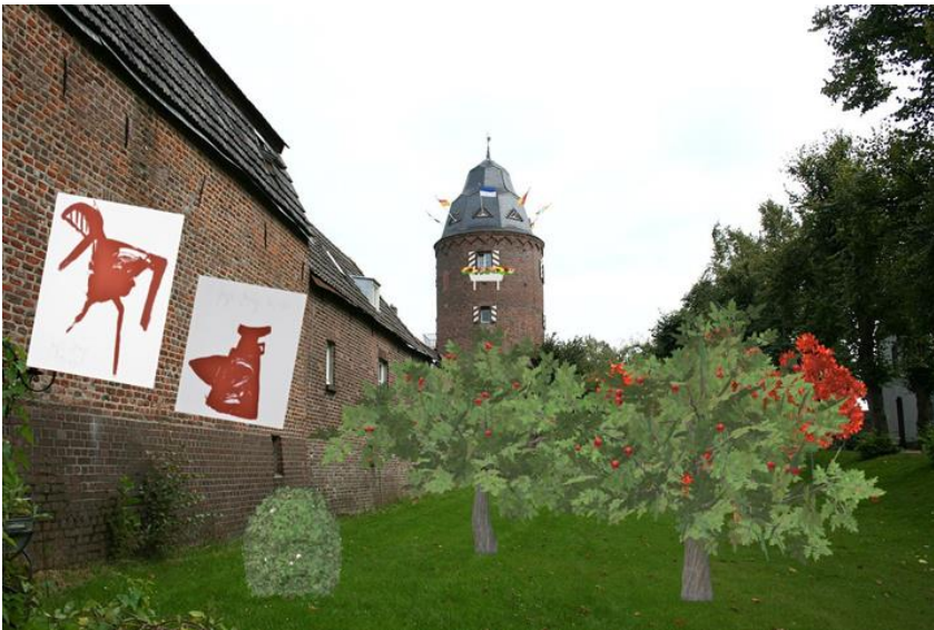
Abbildung 4: Bepflanzung - Mühlenturm

Häuser, die an der Stelle der ehemaligen Stadtmauer stehen, dezent mit Werken von zum Beispiel Beuys oder van der Grinten zu modifizieren, sodass weitere Außenbereiche der Stadt zum prächtigen Allgemeinbild hinzukommen (s. Abb. 4).