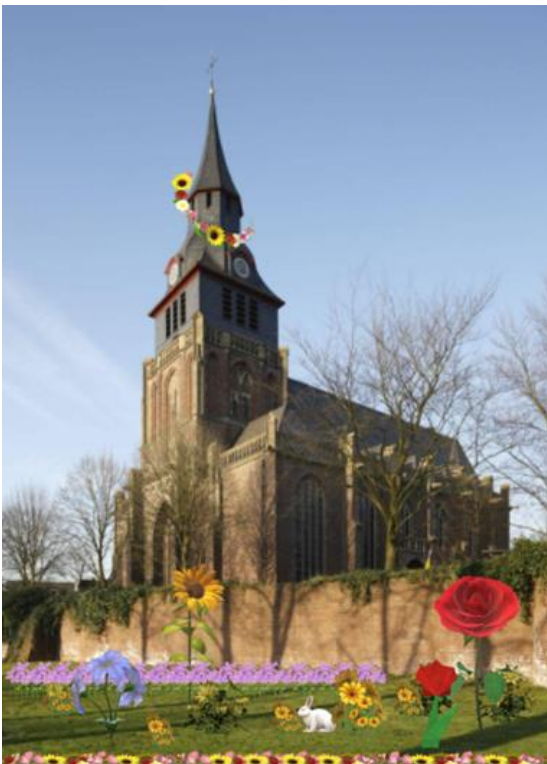
Abbildung 3: Bepflanzung - Pfarrkirche St. Peter und Paul

Eine der Besonderheiten der Kirche stellt ihre reiche Ausstattung dar, die im Laufe der Jahrhunderte zusammengetragen wurde. Bei der Besichtigung der Kirchenanlagen fiel auf, dass die Umgebung relativ einfach mit Rasen bepflanzt wurde. Im Verlaufe der Präsentation bekamen wir die Information, dass diese Rasenflächen, zum Teil und an bestimmten Zeitpunkten im Jahr, sehr wohl blühende Flächen aufweisen. Wir sind dennoch der Meinung, dass diese Grünflächen optimierter bepflanzt werden könnten, um bestenfalls jahresumfassend oder zumindest großteilig blühende Akzente aufweisen. Einige Büsche oder kleinere Hecken in Kombination zu sogenannten „Bienenwiesen“ würden diesem Areal eine naturverbundene Atmosphäre verschaffen (s. Abb. 3).